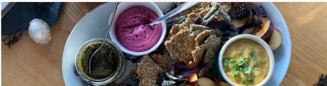
Photo z výstupu z rezidenčního pobytu (Food Ecologies) Uny Hallgrímsdóttir, prosinec 2022 v Cove Park

Součástí akce budou workshopy, včetně workshopu designérky, umělkyně a potravinové aktivistky Mathilde N'Doye z Glasgow.